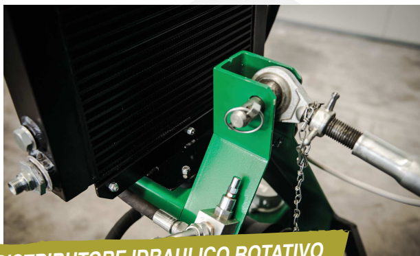
DISTRIBUTORE IDRAULICO ROTATIVO PER TRASMISSIONE MOVIMENTO PIATTO ROTANTE