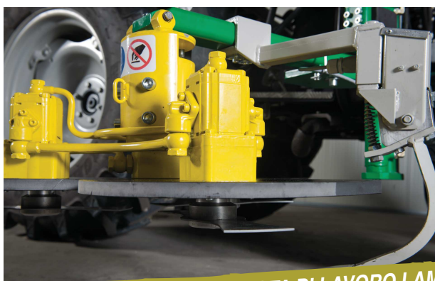
CONTROLLO CONTINUO QUOTA DI LAVORO LAME