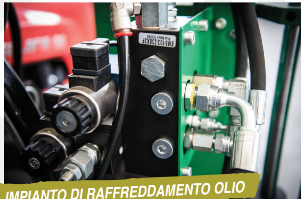
IMPIANTO DI RAFFREDDAMENTO OLIO