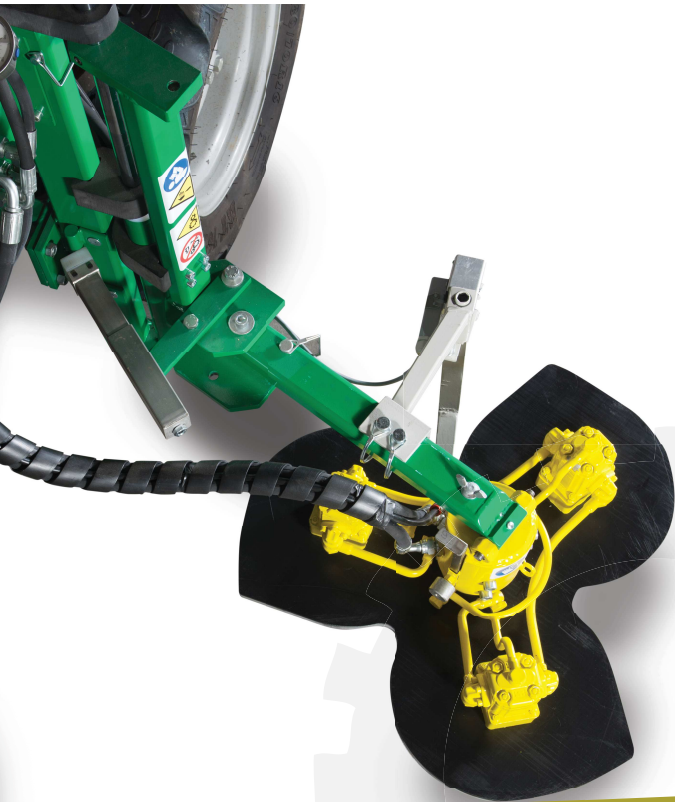
SISTEMA COMPENSAZIONE MOVIMENTO BRACCIO