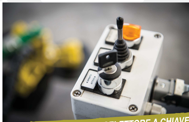
SCATOLA COMANDI CON SELETTORE A CHIAVE