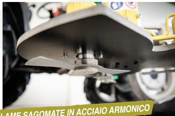
LAME SAGOMATE IN ACCIAIO ARMONICO